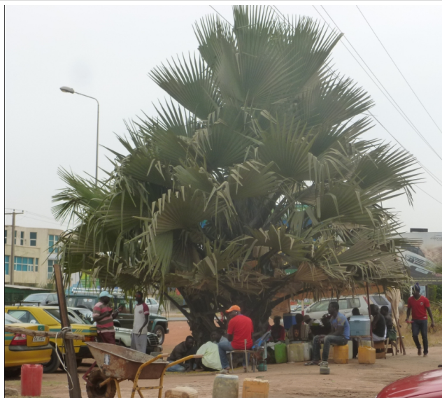
Links unten: erste Taxis am Highway