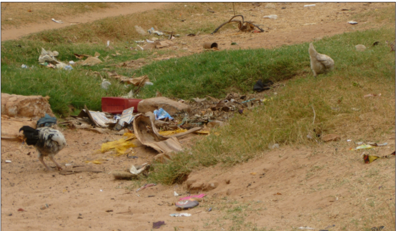
Detail der Straße, um die Ausprägung der Struktur kenntlich zu machen.