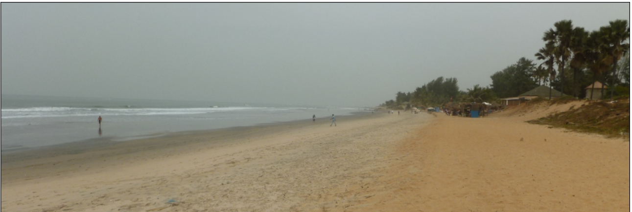
Der Weg nach Norden zu Pa Joob wird sich wohl ziehen.