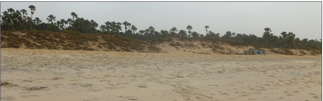
Kontrollblick auf den Monkey Park zurück, von wo ich kam.