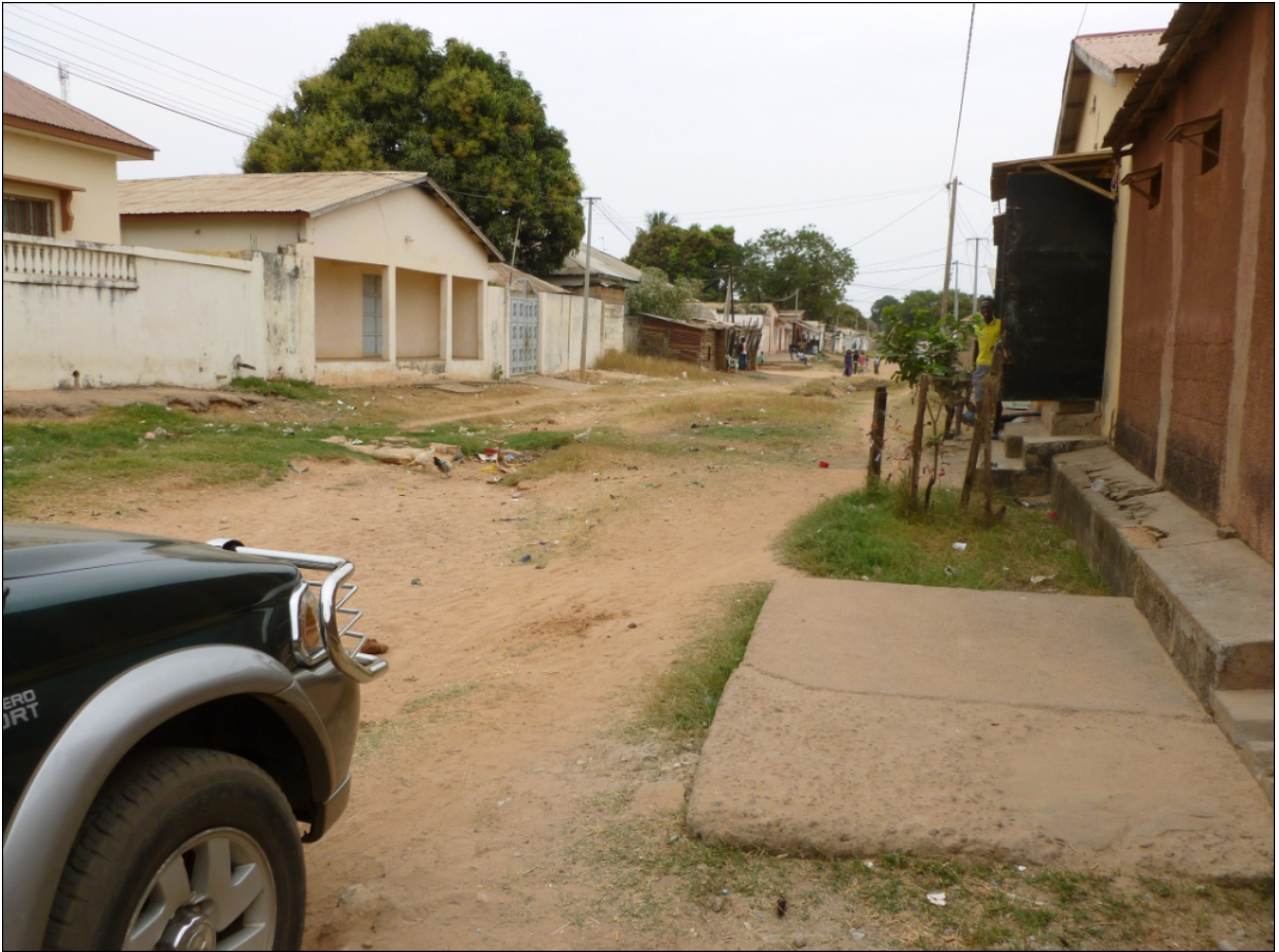
Rechts ist der Eingang zu Ramus Räumen im Compound ihres Bruders Pa.