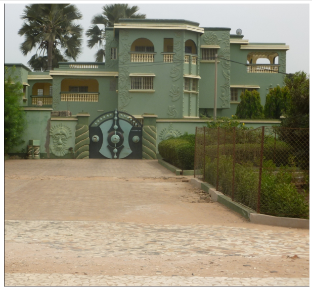
Und gegenüber: nobel wohnen

Stellvertretend für die Studien am Nahverkehr nutzen wir unsere Abreise mit dem vorher noch im ausgeliehenen Auto absolvierten Besuch bei meiner Enkelin Aisha.