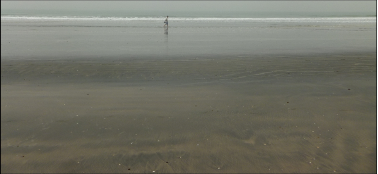
Ich bin nur ein Dreikäsehoch.