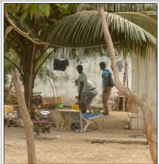
Fußwaschung am Wasserhahn